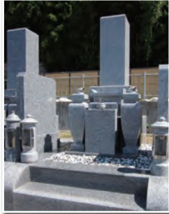
2.0 聖地 (和型)