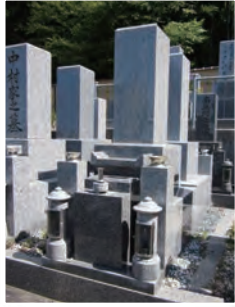
1.0 聖地 (和型)