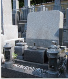
1.0 聖地 (洋型)