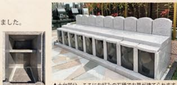
▲土台部分。ここにお好みの石種でお墓が建てられます。

◇独立した収骨室 収骨室はそれぞれのご家族ごとに仕切られています。上段の棚に小骨を残す事で何体でもお納めいただけます。