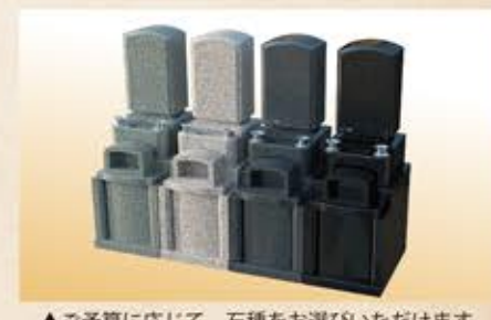
▲ご予算に応じて、石種をお選びいただけます。

◇コンパクトなデザイン 石種や彫刻も自由に選べるスタイリッシュなお墓。お掃除もラクラク。草むしりなどの煩わしい手間がありません。