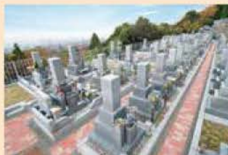
水はけの良い、お参りしやすい参道