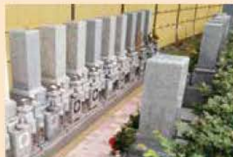
すでに沢山のご縁をいただきました