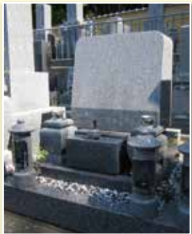
1.0 聖地 (洋型)