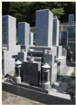
1.0 聖地 (和型)