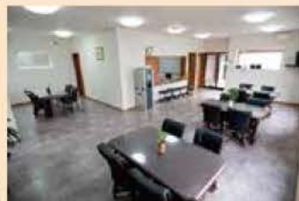
ご休憩に利用できる管理棟