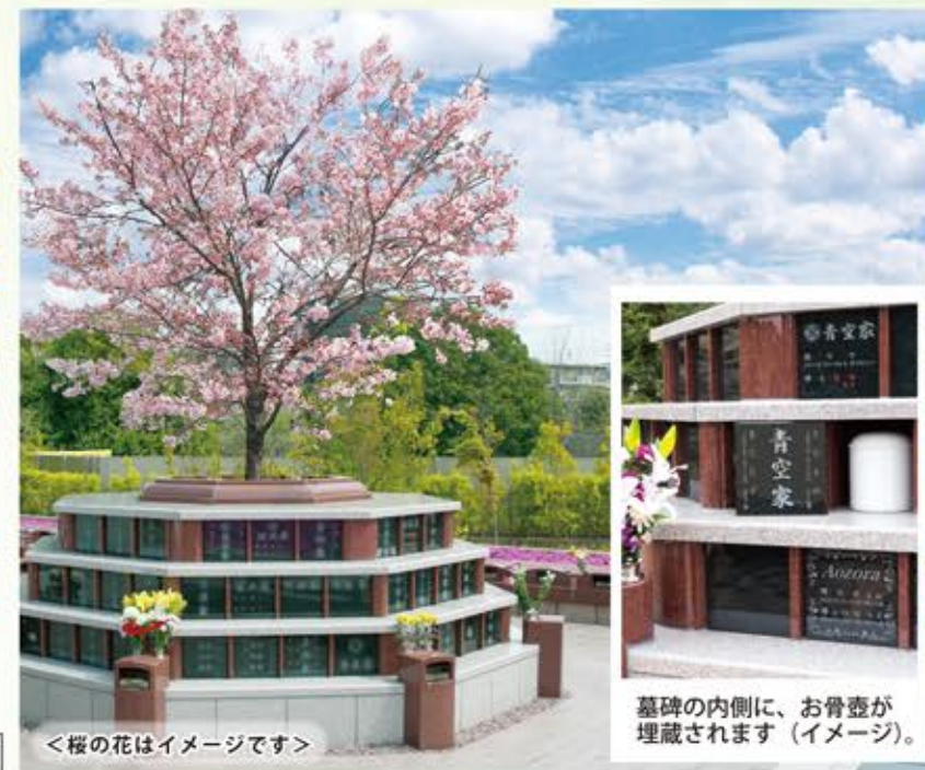
<桜の花はイメージです>