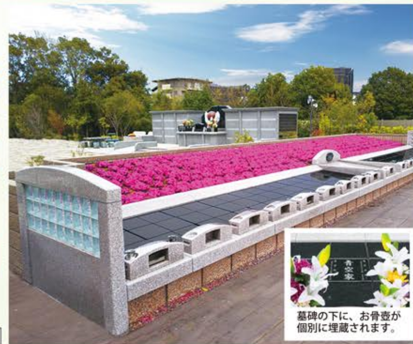
墓碑の下に、お骨壺が個別に埋蔵されます。